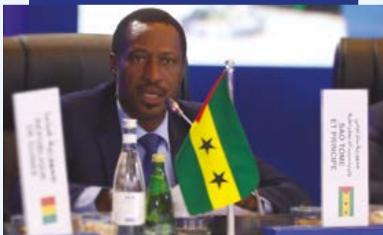
MR. FRANCISCO MARTINS DOS RAMOS MINISTRE DE L'AGRICULTURE, DE LA PÊCHE ET DU DÉVELOPPEMENT RURAL (SAO TOMÉ- ET-PRINCIPE)

“ Sachant les défis majeurs auxquels l'Afrique fait face, l'initiative de la Ceinture Bleue est une réelle opportunité de l'intégration inclusive qui pourra faciliter l'approche collaborative et proposer d'éventuels mécanismes de types financiers appropriés dans plusieurs domaines d'activité comme la pêche, l'aquaculture, la sécurité et la surveillance maritime et permettra la création d'emploi et des richesses tout en contribuant à la conservation du patrimoine naturel des océans. ”