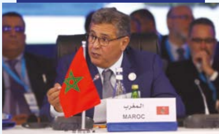
MR. AZIZ AKHANNOUCH MINISTRE DE L'AGRICULTURE, DE LA PÊCHE MARITIME, DU DÉVELOPPEMENT RURAL ET DES EAUX ET FORÊTS (ROYAUME DU MAROC)

“ Avec l'initiative de la Ceinture Bleue, le Royaume clame sa conviction que la pêche et l'aquaculture peuvent constituer un modèle de durabilité générateur de valeur et d'emplois face aux défis des changements climatiques. ”