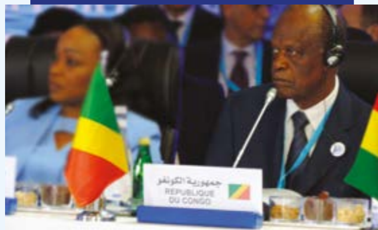
MR. HENRI DJOMBO MINISTRE D'ETAT CHARGÉ DE L'AGRICULTURE, DE L'ÉLEVAGE ET DE LA PÊCHE (RÉPUBLIQUE DU CONGO)

“ Nos intelligences doivent donc se focaliser sur le financement et l'aboutissement de ces initiatives, en vue de soutenir l'aquaculture, la pêche responsable et résiliente aux effets du changement climatique, les projets de préservation des écosystèmes marins et côtiers et l'amélioration du cadre de vie des populations concernées par les économies verte et bleue. ”