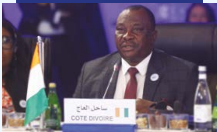
MR. KOBENAN KOUASSI ADJOUANI MINISTRE DES RESSOURCES ANIMALES ET HALIEUTIQUES (CÔTE D'IVOIRE) ET PRÉSIDENT EN EXERCICE DE LA COMHAFAT

“ Avec l'initiative de la Ceinture Bleue, le Royaume clame sa conviction que la pêche et l'aquaculture peuvent constituer un modèle de durabilité générateur de valeur et d'emplois face aux défis des changements climatiques. ”