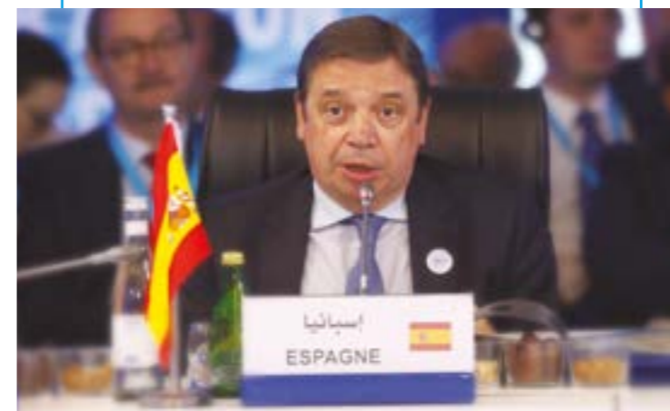
MR. LUIS PLANAS PUCHADES MINISTRE DE L'AGRICULTURE, DE LA PÊCHE ET DE L'ALIMENTATION (ESPAGNE)

“ Dès lors que nous partageons les mêmes stocks de ressources animales et halieutiques, surtout en ce qui concerne les ressources halieutiques, il y a une nécessité impérieuse d'harmoniser les mesures de gestion en partageant nos différentes expériences. C'est en cela que l'initiative Ceinture Bleue du Maroc est salutaire pour nos différents Etats. ”