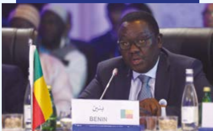
MR. GASTON COSSI DOSSOUHOUI MINISTRE DE L'AGRICULTURE DE L'ÉLEVAGE ET DE LA PÊCHE (BÉNIN)

“ Sachant les défis majeurs auxquels l'Afrique fait face, l'initiative de la Ceinture Bleue est une réelle opportunité de l'intégration inclusive qui pourra faciliter l'approche collaborative et proposer d'éventuels mécanismes de types financiers appropriés dans plusieurs domaines d'activité comme la pêche, l'aquaculture, la sécurité et la surveillance maritime et permettra la création d'emploi et des richesses tout en contribuant à la conservation du patrimoine naturel des océans. ”