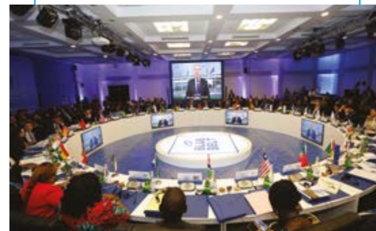
MR. KARMENU VELLA COMMISSAIRE EUROPÉEN POUR L'ENVIRONNEMENT, LES AFFAIRES MARITIMES ET LES PÊCHERIES (UNION EUROPÉENNE)

“ Comme vous le savez, le Maroc est pour l'Union Européenne davantage qu'un voisin. C'est un partenaire. Au fil des ans, nous avons développé de précieux partenariats dans de nombreux domaines. L'économie maritime « bleue » est l'un d'entre eux.