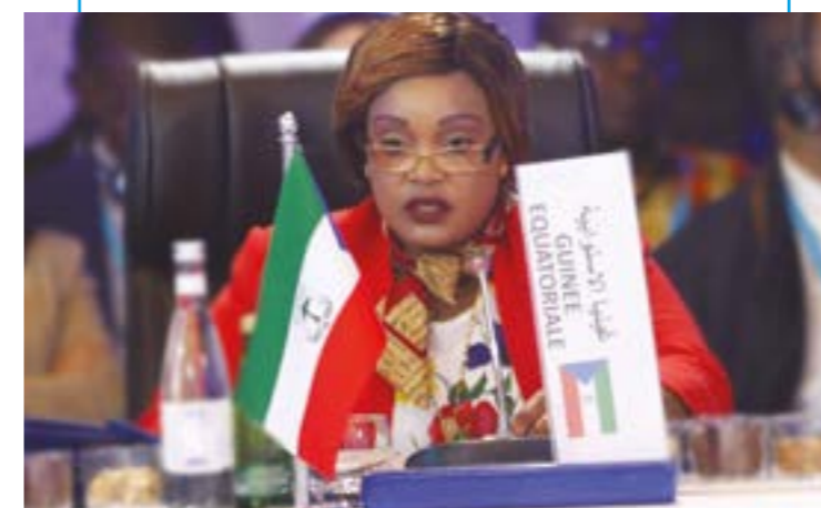
MME. ADORACIÓN SALAS CHONCO MINISTRE DE LA PÊCHE ET DES RESSOURCES HYDRIQUES (GUINÉE EQUATORIALE)

“ C'est une stratégie intelligente pour une croissance durable et inclusive. Le potentiel de l'océan pour répondre aux besoins en développement durable est énorme. Mais seulement si nous pouvons gérer de manière à le garder dans un état sain de production. ”